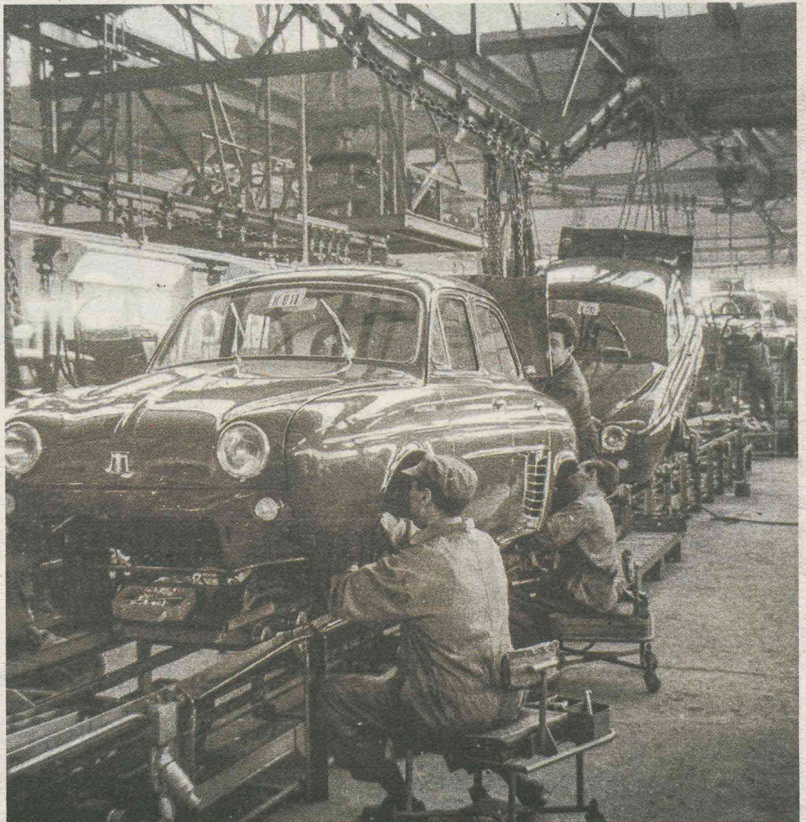
ARCHIVO MUNICIPAL DE VALLADOLID