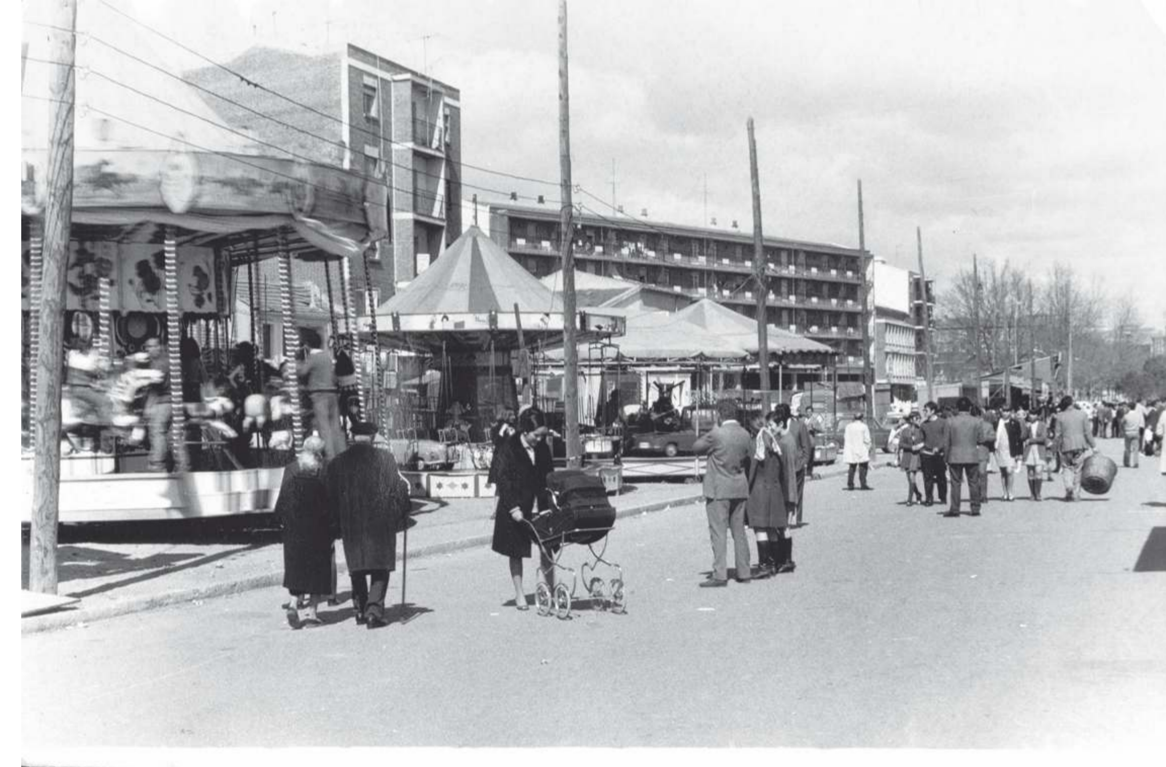
¿Quién no se acuerda del "Jané", el "Mercedes" de los bebés? Al fondo se ve el cine "La Rubia". 1970. Fondo Asociación de la Prensa. F 543-26