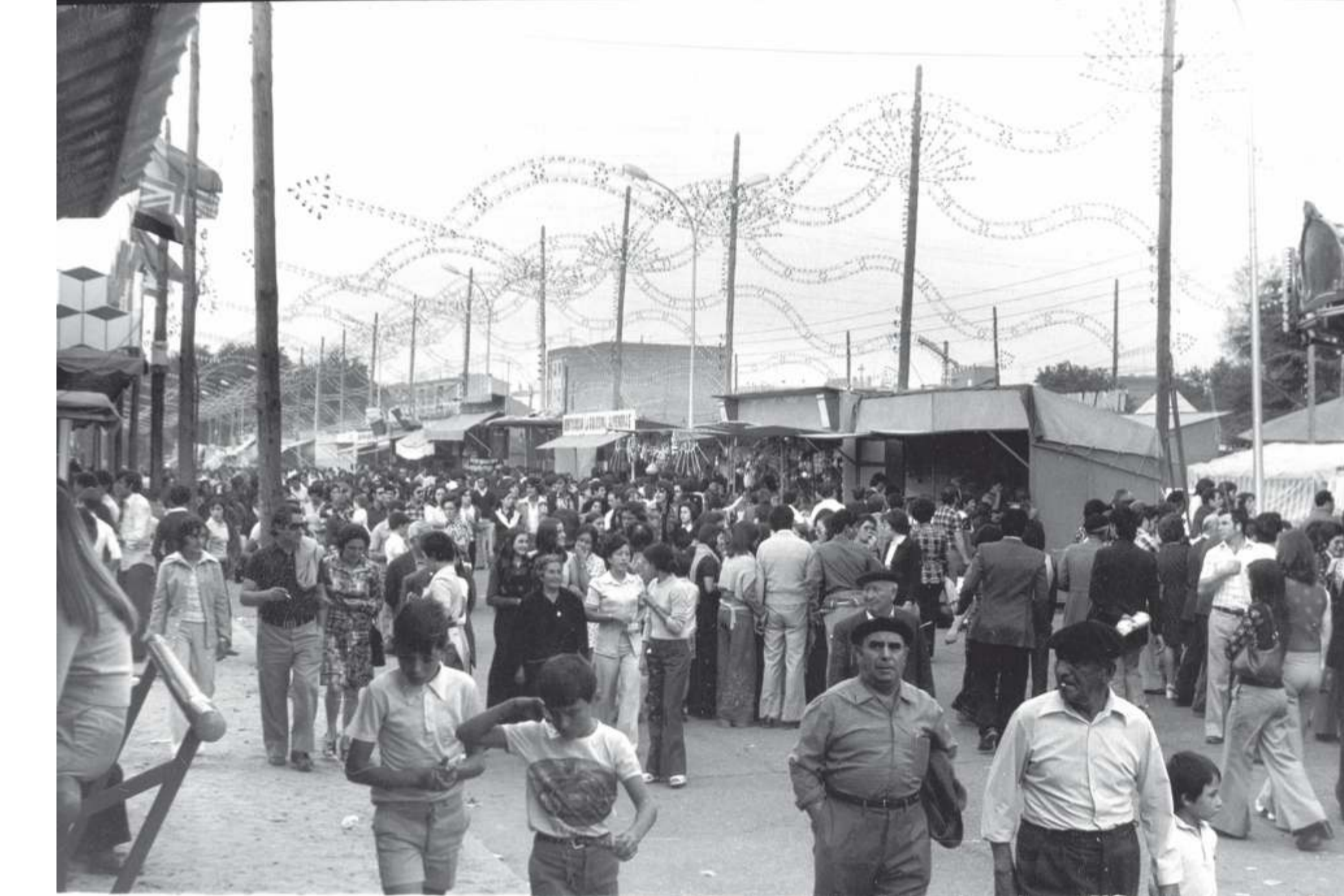
A mediados de los setenta, las clásicas boinas y los pantalones campana convivían en el vestuario popular. Repárese en la sencillez de las casetas. 1974. Fondo Asociación de la Prensa. F 543-15