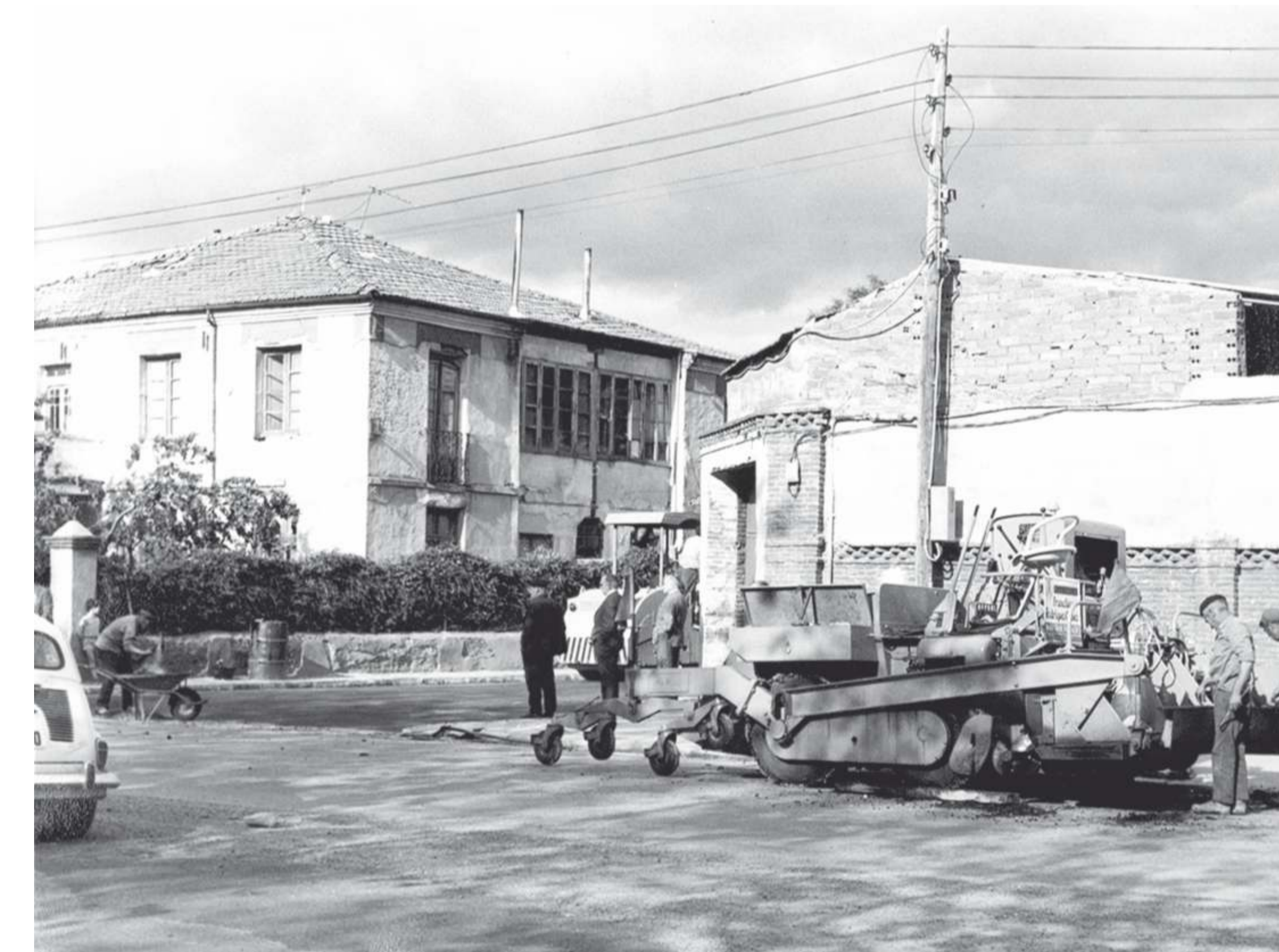
Trabajos de pavimentación en la carretera de Rueda. 197?