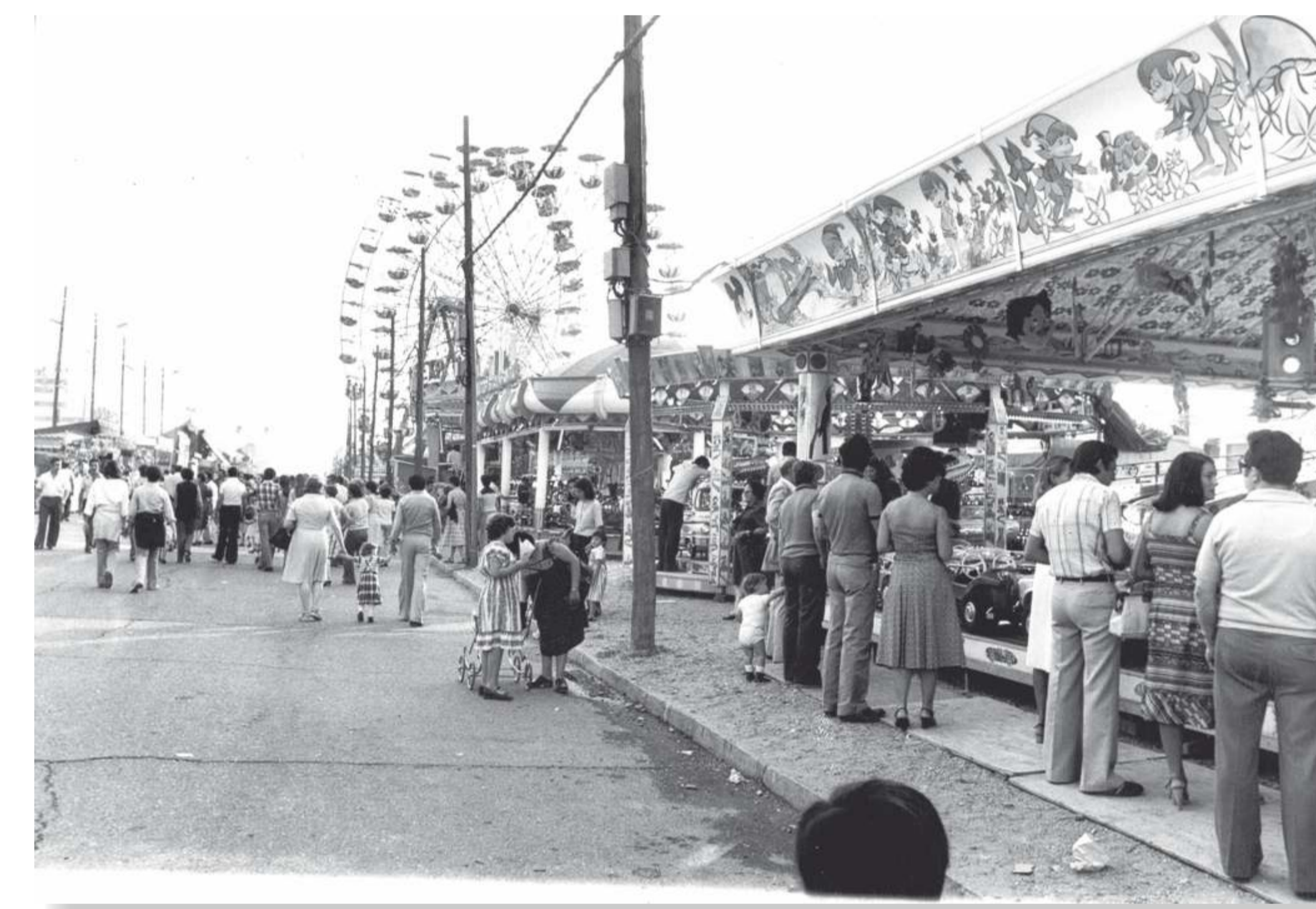
Niños (pequeños y grandes) siempre en el corazón de la feria. 197? F 543-27