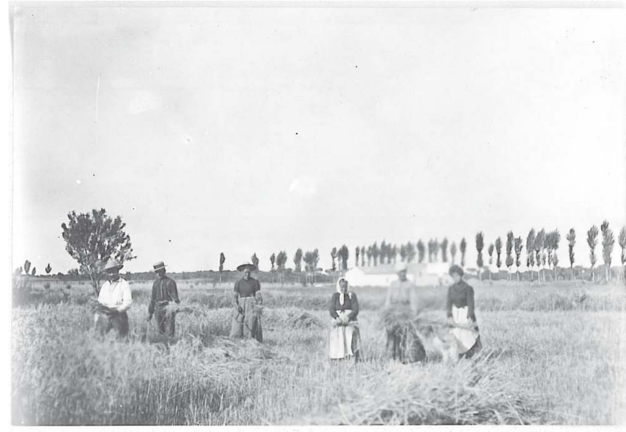
Tiempo de cosecha ¿en la finca de Jalón? 191? Colección Martín de Uña. MU 11