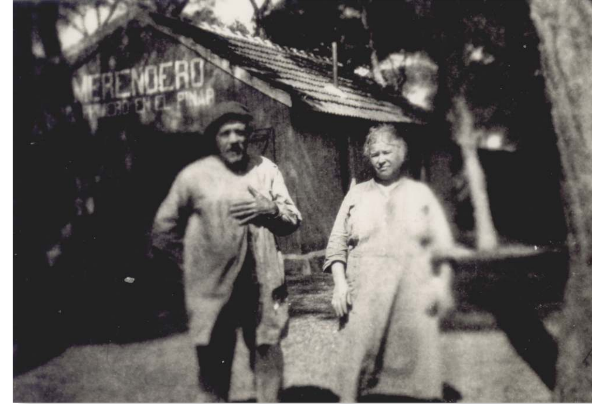
Merendero en el pinar de Antequera. 191? Colección Colegio de los Ingleses. SA 69