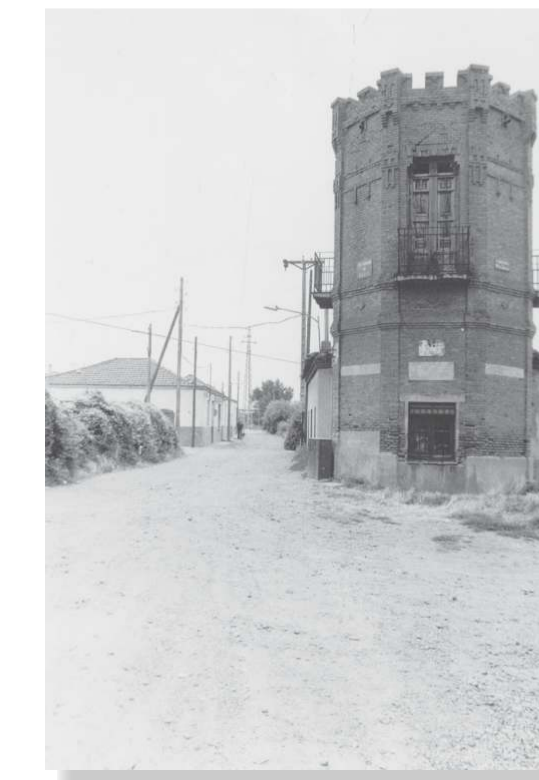
Calle del Torreón. 1981. MC 1-116