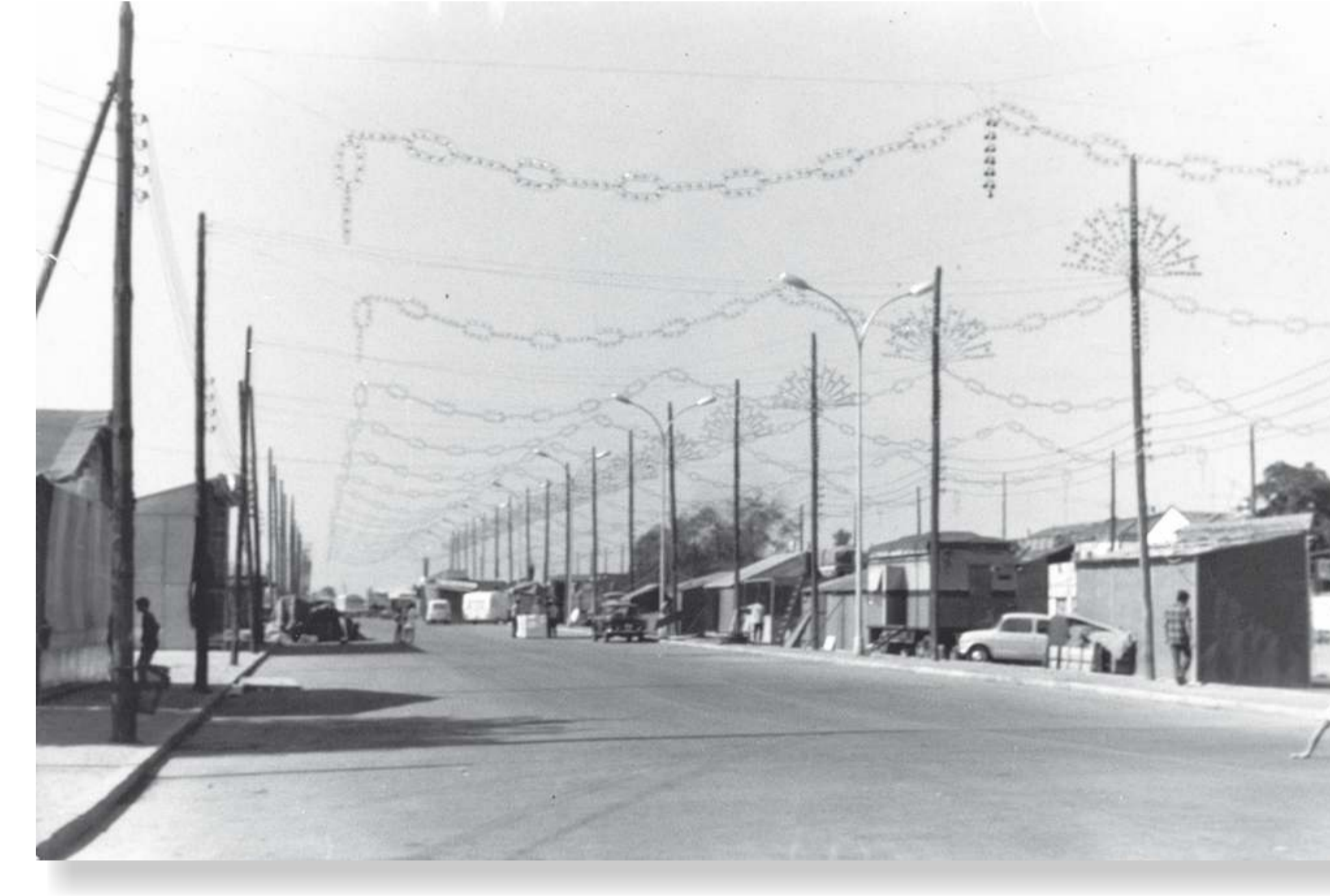
El Real de la Feria en la prolongación del paseo de Zorrilla. 1970. F 543-6