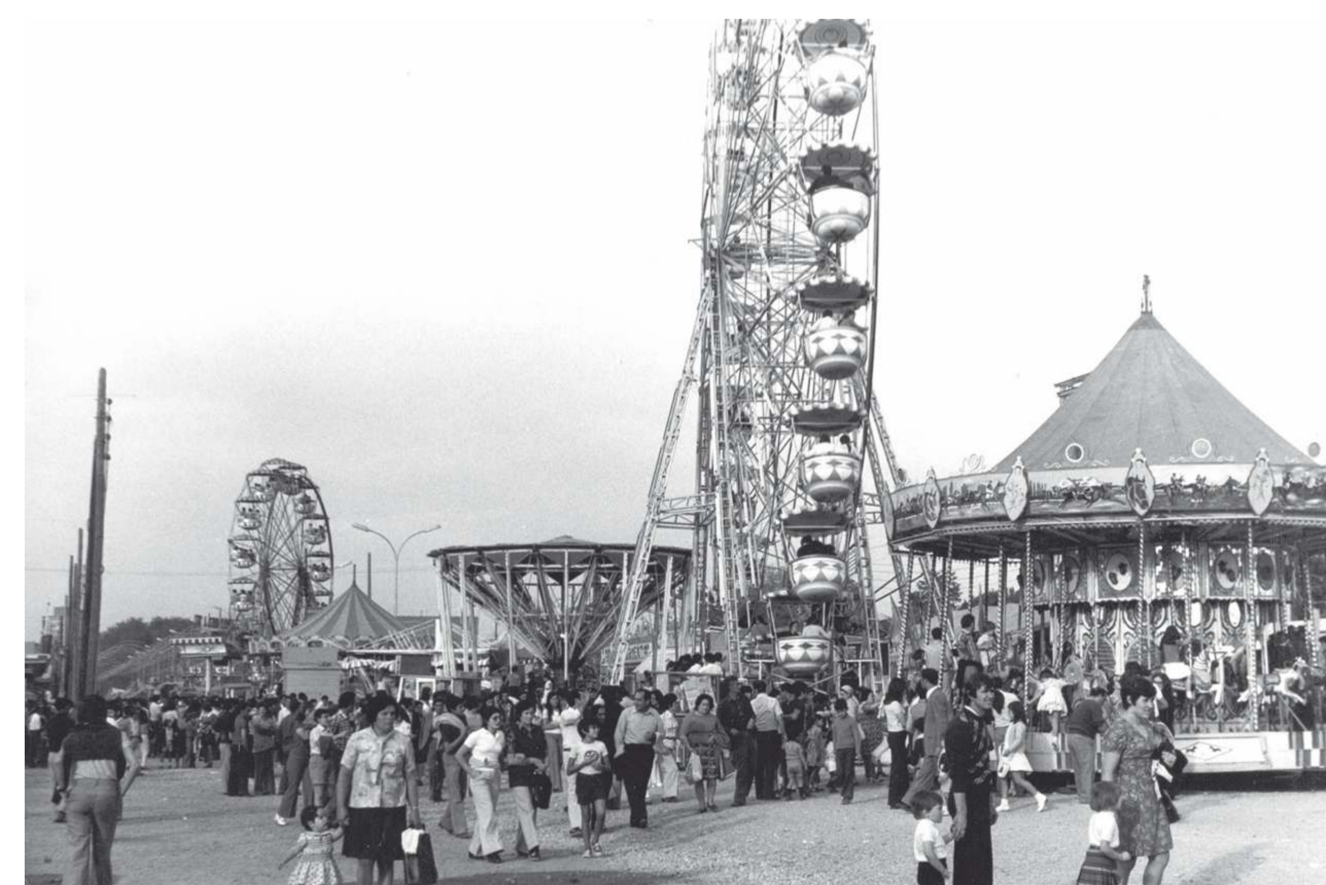
Atracciones de siempre: caballitos y noria. 197? Fondo Asociación de la Prensa. F 543-19